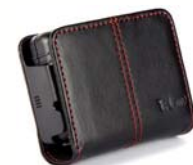
Housse cuir horizontale