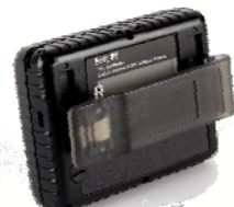
Clip ceinture livré de série