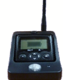
Chargeur avec antenne